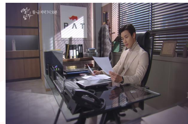
"KBS2 TV 일일" <비밀의 남자 - PAT>