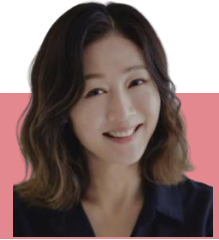
윤길자 (Cast. 방은희 예정) 여 50대 초

모진 풍파를 견디며 살아온 세월만큼 성격에도 굳은살이 배겼다. 하지만 지식에 대한 마음은 32년이 지나도 여전히 굳은살도, 딱지도 앉지 않는 생활이다.