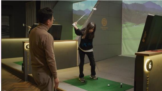
"KBS2 TV 일일" <사랑의 파배기-더스윙블랙>

사전에 브랜드 소구포인트를 주조연의 매장방문, 제품 사용, 식음등을 통해 대본에 반영하여 자연스럽게 노출