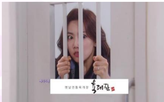
"KBS2 TV 일일" <비밀의 남자 - 육대장>