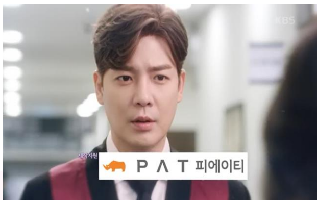
"KBS2 TV 일일" <비밀의 남자 - PAT>