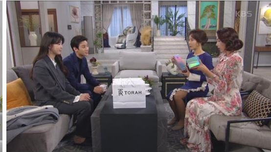
"KBS2 TV 일일" <비밀의 남자-토라>