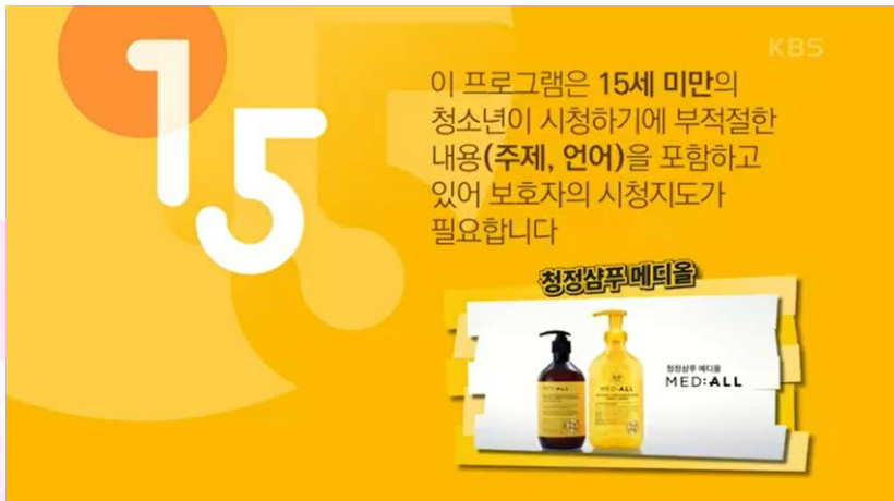
"KBS2 TV 일일" <태풍의 신부 - 메디올>

집중도 높은 영역인 등급고지 및 에필로그에 브랜드 메시지를 영상으로 노출