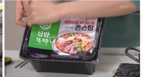
"KBS2 TV 일일" <사랑의 파배기-밀키트 편의점24 집밥똑딱>