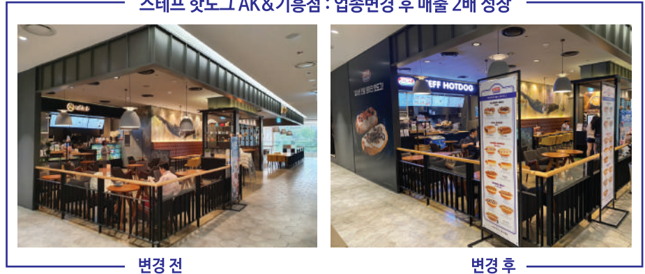
스테프 핫도그 AK&기흥점 : 업종변경 후 매출 2배 성장

기존 운영중인 매장의 주방기기, 가구 및 인테리어 등 사용하던 시설을 최대한 활용한 업종변경 창업