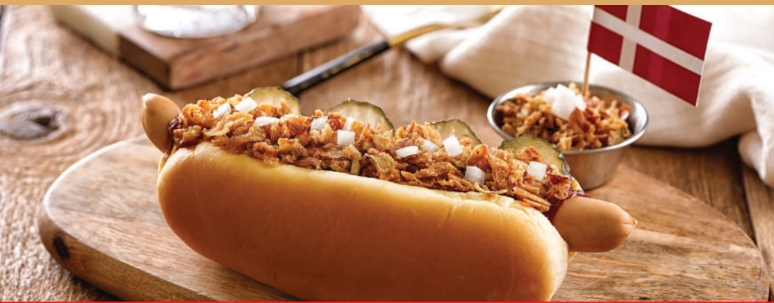
STEFF HOLLBERG 130년 전통의 덴마크 핫도그, 스테프 핫도그