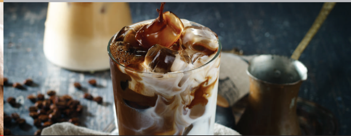
STEFF HOLLBERG 프리미엄 아라비카 원두로 만든 스페셜티 커피